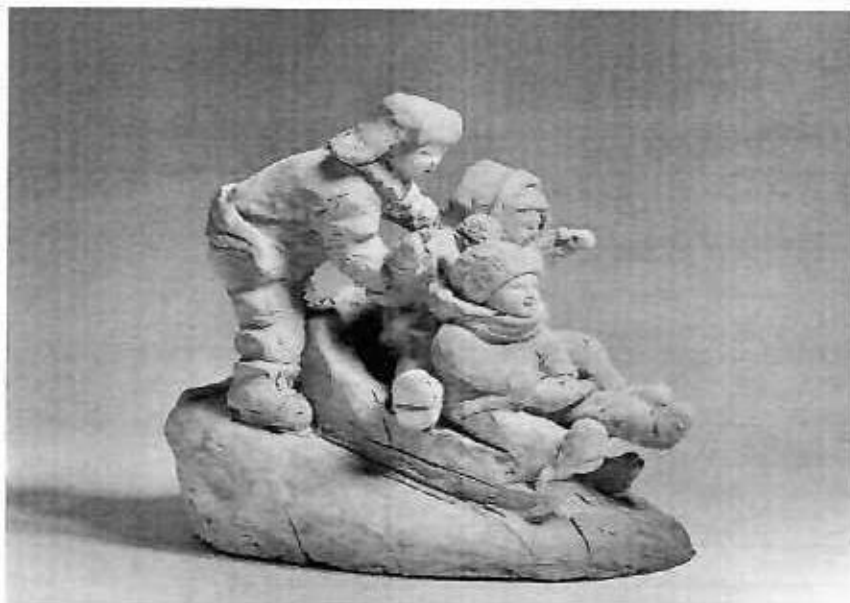
Композиция бойынша тапсырма үлгісі

● Шығармашылық емтихандарды бағалау критерийлері: