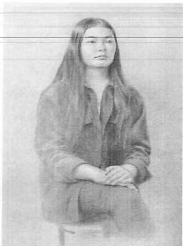
Сурет бойынша тапсырма үлгісі