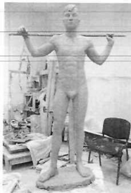
Мүсін бойынша тапсырма үлгісі